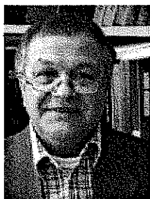
لوتس هردن، 22 ژوئن 2007 بفارسي از حميد بهشتي

در باره جلوگيري از برادرکشي، توطئه فتح و از بين بردن علاقه به دموکراسي